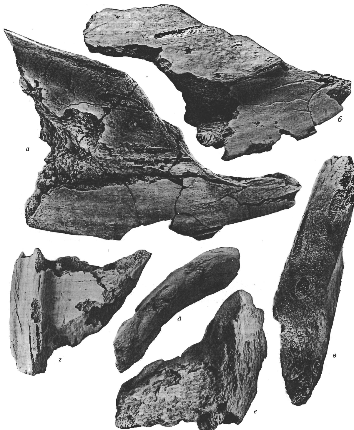
Рис. 2. Зубные пластины Edaphodon eolucifer sp. nov. ( \times 1.1 ): a – голотип ВОКМ, № 30900/40, левая нижнечелюстная (“мандибулярная”) пластина, вид с окклюзарно-симфизной поверхности; б, в – экз. ВОКМ, № 30900/41, левая нижнечелюстная пластина, б – вид с симфизно-окклюзарной поверхности; в – вид с окклюзарной поверхности; г – экз. ВОКМ, № 30900/43, правая передняя верхнечелюстная (“сошниковая”) пластина, вид с окклюзарно-симфизной поверхности; д, е – экз. ВОКМ, № 30900/42, правая передняя верхнечелюстная пластина, д – вид с окклюзарно-симфизной поверхности, е – лабиально.